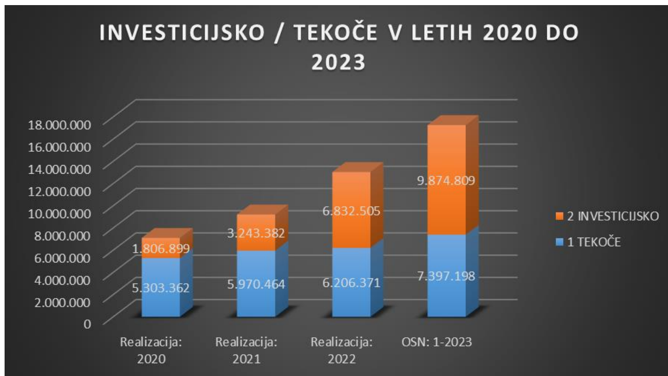
Slika 8: Primerjava med leti 2020 do 2023