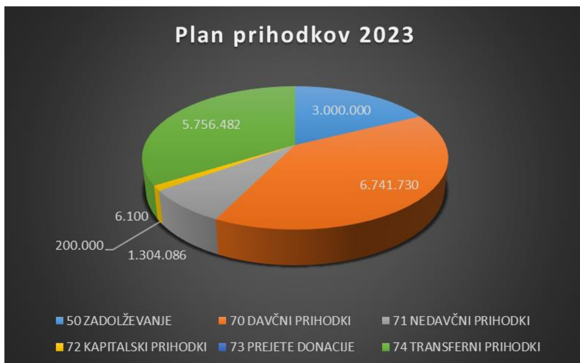
Slika 10: Plan prihodkov za leto 2023