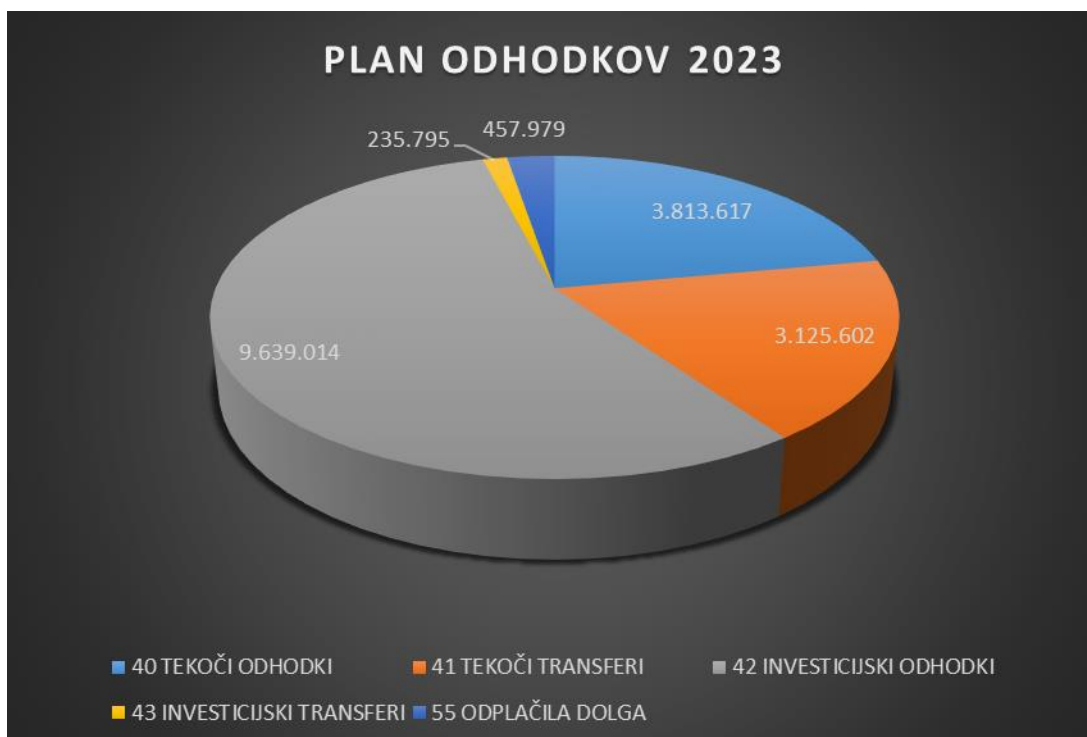
Slika 9: Plan odhodkov za leto 2023